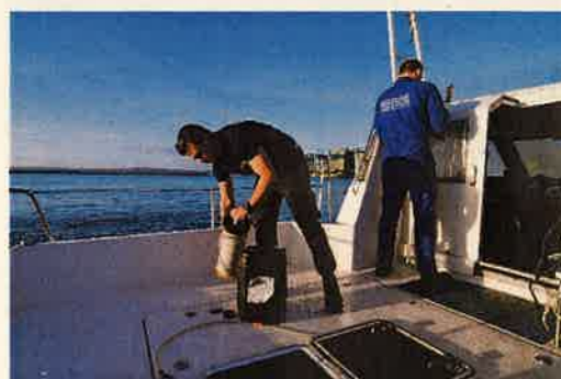
Un adjoint service portuaire