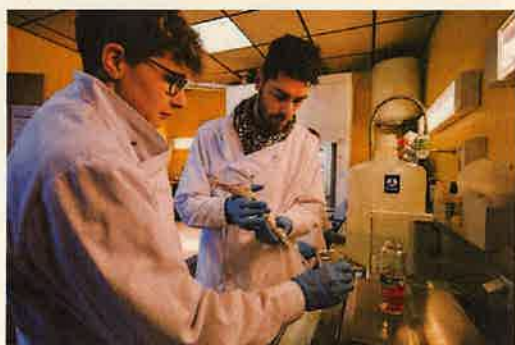
Un technicien de laboratoire