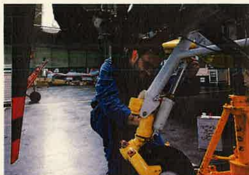
Un chargé de maintenance aéronautique